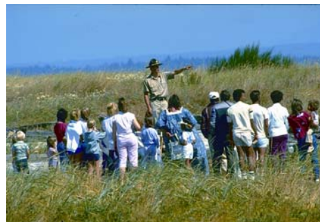
有解说员的海滩步行之旅