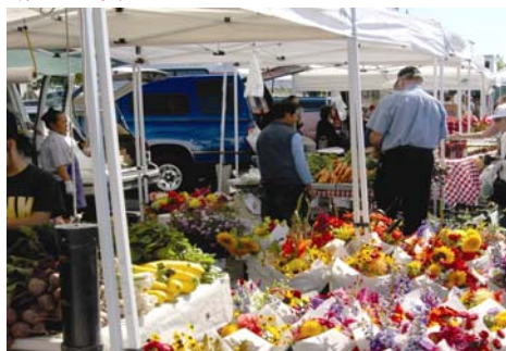
埃弗雷特的农夫市场