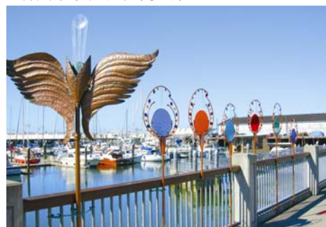
埃弗雷特的水滨景区