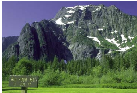
Big Four Mountain mit Eishöhlen