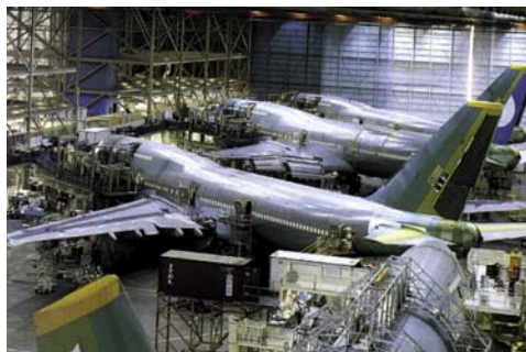
Montage einer 747 im Boeing-Werk