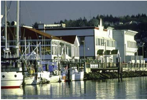
Der Hafen in Everett

Diesen "Blick auf Snohomish County" bietet Ihnen das Verkehrsbüro von Snohomish County (Snohomish County Tourism Bureau), das im Nordwesten des Bundesstaates Washington (USA), nördlich von Seattle liegt. Unter der Nummer 1-425-348-5802 können Sie eine CD mit 100 eindrucksvollen Fotos bestellen, oder besuchen Sie unsere Website www.snohomish.org .