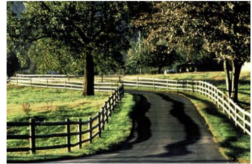
Ruhige, landschaftlich reizvolle Straßen