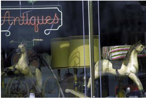
Snohomish, "Die Antiquitäten-Hauptstadt"