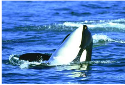
Bootsausflüge zur Walbeobachtung