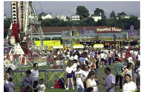
Festivals & Events