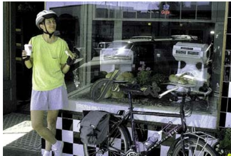
Mit dem Fahrrad von Bäckerei zu Bäckerei