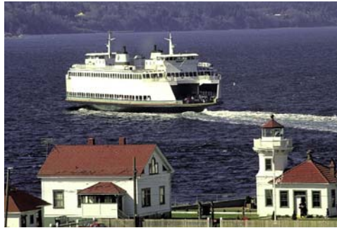
Mukilteo - Leuchtturm und Fähre