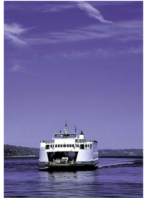
Die Fähre von Edmonds aus