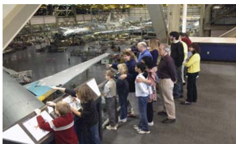
Завод по сборке Боингов 777-787