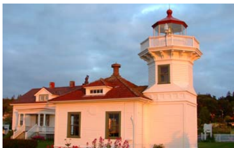
Маяк в Мукалтио