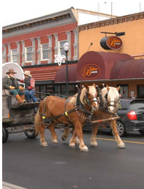
Арлингтон. Поездки на лошадях.