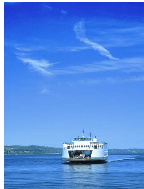
Паром в Эдмондсе