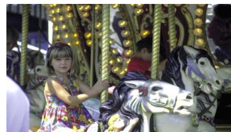
Праздники и знаменательные события