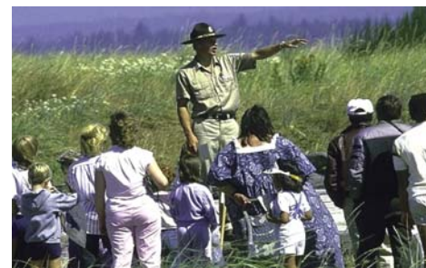
Познавательные прогулки по побережью