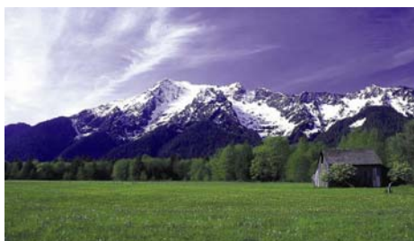
Гора Вайт хорс