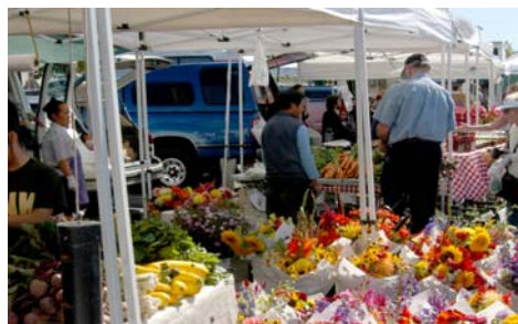
Эверетт. Фермерский рынок