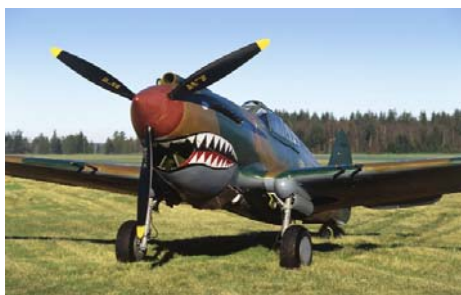
Коллекция лётного наследия