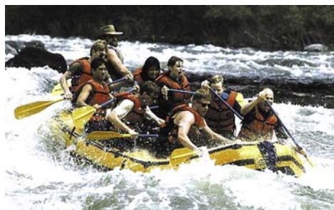
Рафтинг на реке с порогами